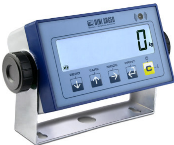
DFWL: több funkciós súly kijelző.