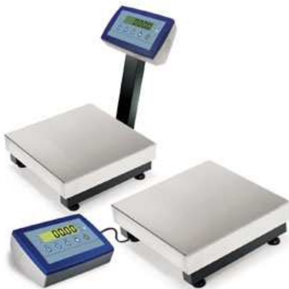
EPQ30 modell TQNC opcióval és nélküle