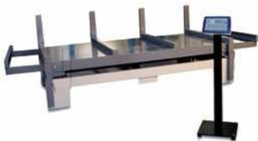
ESW opciós állvánnyal