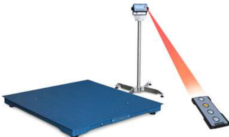
FL mérőlap sorozat és DFWL többfunkciós kijelző opciós állvánnyal és távirányítóval