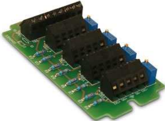
JC4Q: kötöző és arányosító kártya 4 bemenettel.