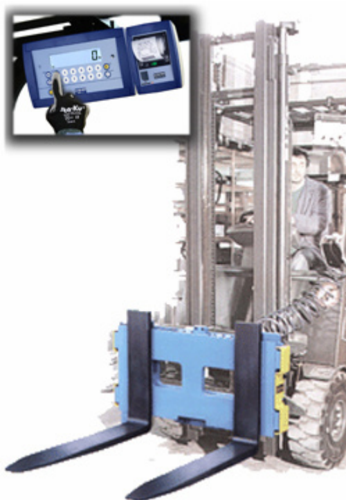
LTW opciós termikus nyomtatóval