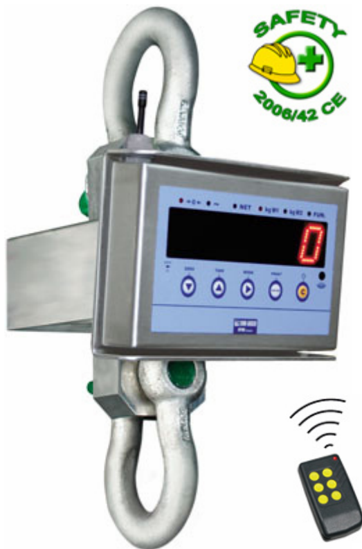
MCW09: IP67-es rozsdamentes acél darumérleg, opciós rádiófrekvenciás modulal.