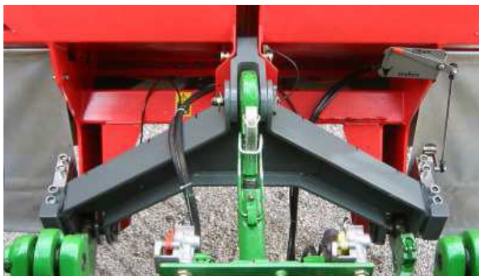
WD2 mérőháromszög, mérleg traktorra

A WD 2 mérőháromszöget azért fejlesztették ki, hogy a 2-es kategóriájú vontatmányt / függesztményt közvetlenül a traktor hárompontos függesztőművén lehessen mérni. A mérőháromszöget úgy tervezték, hogy a függesztett eszköz súlypontja csak néhány cm-rel kerüljön hátrébb. A függesztett/csatolt eszközök, mint például trágyaszórók, szállítóládák, keverő kocsik gyorsan kapcsolhatók és nagy pontossággal mérhetők.